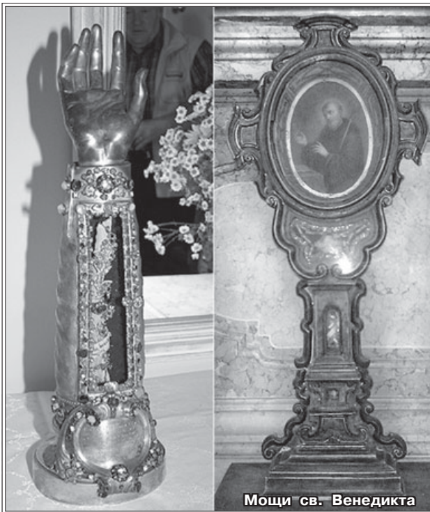
Мощи св. Венедикта

Православные верующие Мюнхена в день памяти преп. Венедикта посещают храмы, где хранятся мощи святого, чтобы поклониться святыням, одинаково почитаемым и католиками, и православными. Возможно, в будущем будет получено и разрешение на совершение православных молебнов перед мощами, как это уже имеет место в яреде католических храмов Европы.