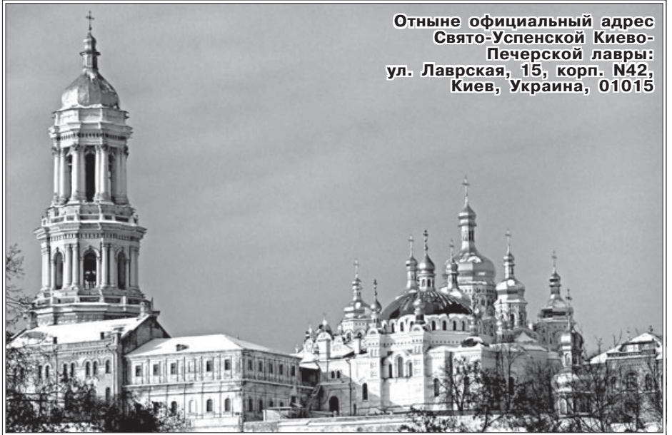
Отныне официальный адрес Свято-Успенской Киево-Печерской лавры: ул. Лаврская, 15, корп. N42, Киев, Украина, 01015

В свою очередь Д.Голендер указала на то, что на Святую Землю венчаться приезжают многие жители России, совершается много смешанных браков.